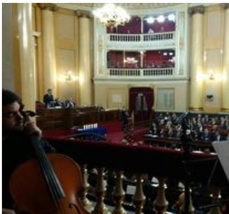
SENAAT VAN SPANJE (MADRID)