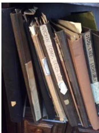
NOG TE DIGITALISEREN

Een groot deel van de composities van vervolgde componisten is niet uitgegeven. De handgeschreven partituren worden in verschillende archieven bewaard, de meerderheid ligt bij het Nederlands Muziek Instituut (NMI) in Den Haag. Op dit moment is het nog een omslachtige en tijdrovende procedure om deze manuscripten op te vragen en in te zien. Daarom is de Leo Smit Stichting samen met het NMI begonnen aan een project om zo'n 20.000 pagina's manuscript te digitaliseren. Donemus Publishing BV maakt ook deel uit van het projectteam, zij zullen de gescande manuscripten via hun webshop tegen onkostenvergoeding aanbieden, waardoor geen nieuwe infrastructuur gebouwd hoeft te worden.