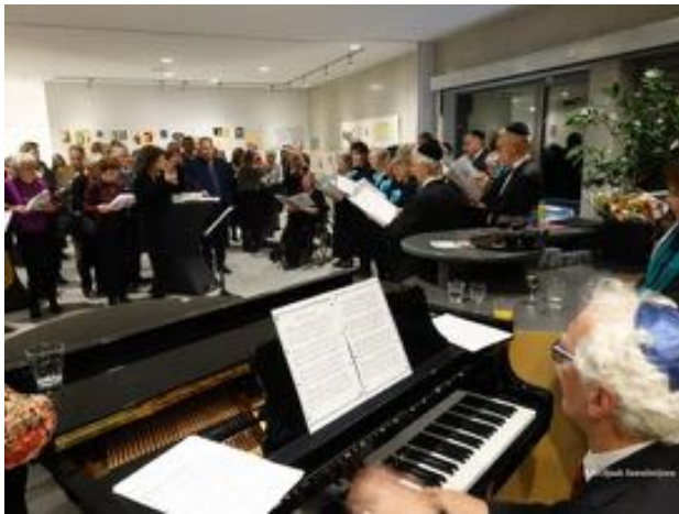
OPENING TENTOONSTELLING LJG

Er is hard gewerkt aan het digitaliseren van manuscripten teneinde deze toegankelijk te maken voor