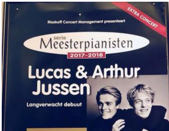
LEO SMIT: DIVERTIMENTO

Voor het eerst in de geschiedenis van de Leo Smit Stichting lag de nadruk in 2018 niet op het organiseren van concerten, maar op het toegankelijk maken van het cultureel erfgoed van vervolgde componisten voor een breder publiek. De rol van de Leo Smit Stichting als kennismakelaar krijgt steeds meer vorm.