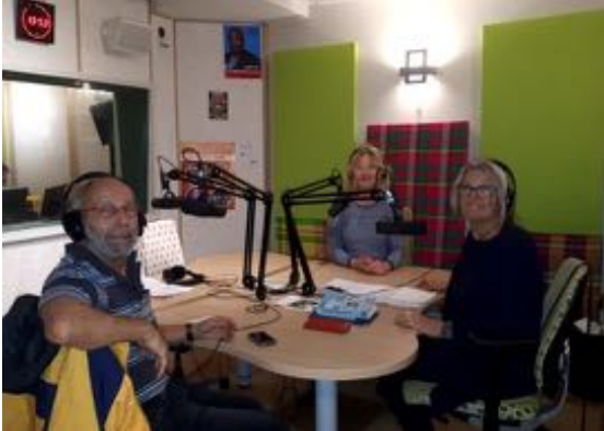
IN DE STUDIO VAN DE AMSTERDAMSE OMROEP SALTO