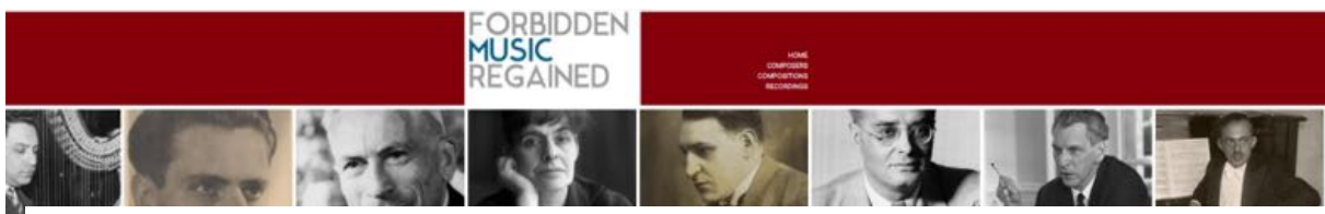
WEBSITE 'FORBIDDEN MUSIC REGAINED'